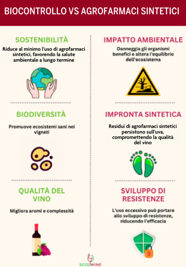
Figura 1 - www.eco2wine.eu

(parassitismo, antibiosi), competizione per nutrienti e spazio, induzione di resistenza sistemica nella pianta ospite e formazione di biofilm protettivi. Alcuni BCA, come Bacillus subtilis , producono lipopeptidi ad azione antifungina (iturina, surfactina); altri, come Trichoderma harzianum , rilasciano enzimi litici capaci di degradare la parete cellulare dei patogeni. In molti casi, l'efficacia del biocontrollo è potenziata dalla sinergia tra diverse specie, suggerendo approcci formulativi basati su consorzi microbici (vedi box qui sotto).